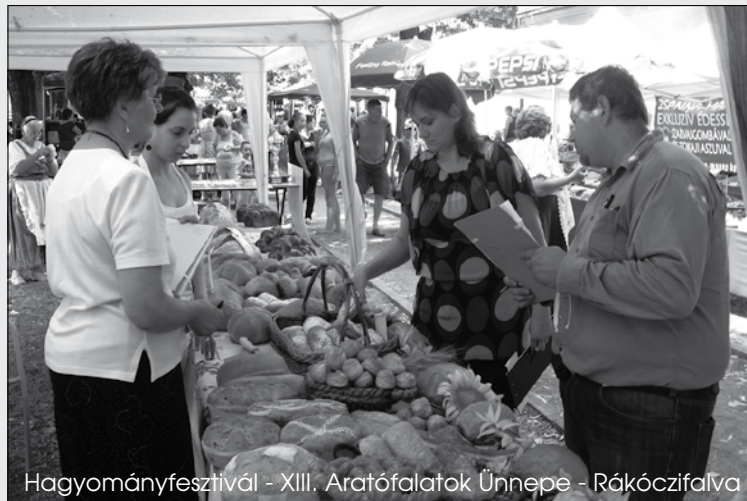
Hagyományfesztivál - XIII. Aratófalatok Ünnepe - Rákóczifalva