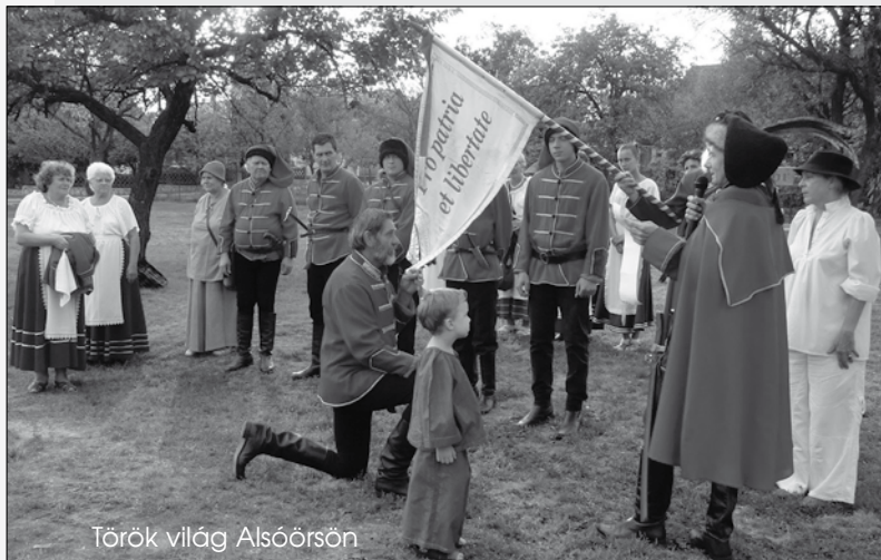
Török világ Alsóörsön