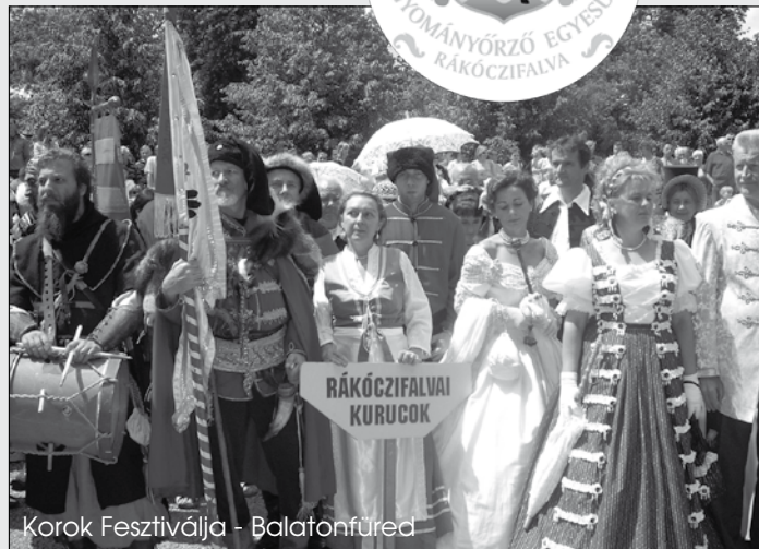
Korok Fesztiválja - Balatonfüred