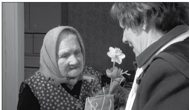
Községünk tizenhárom legidősebb hölgyét köszöntötte a Nemzetközi Nőnap alkalmából önkormányzatunk.