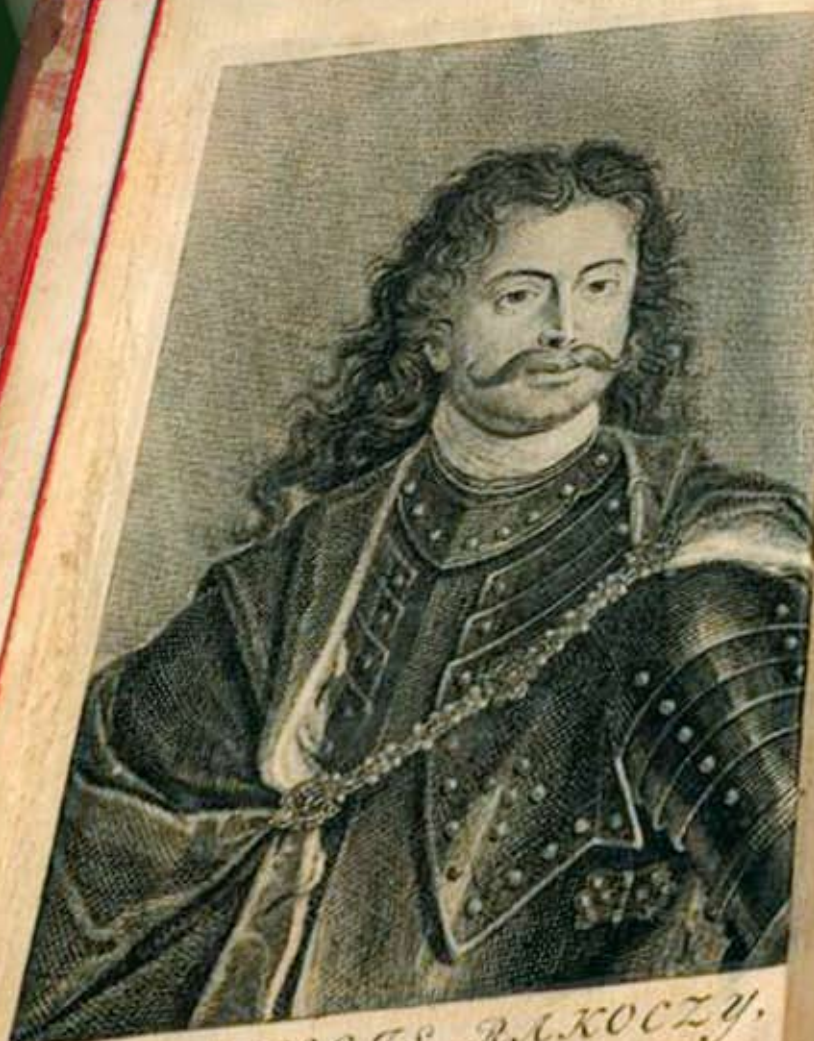
FRANÇOIS RÁKÓCZY, Prince de Transilvanie.

Rákóczi Falviak Lapja 2009. Második szám