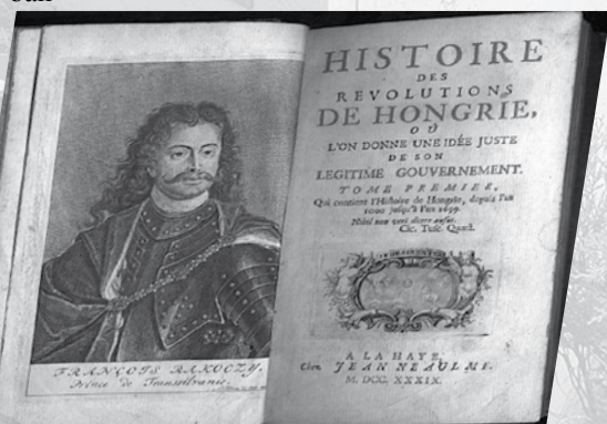
Rákóczi emlékiratainak 1739-ben (270 éve), Hágában megjelent első kiadása

1735. április 8. – a fejedelem elhunyt Rodostóban