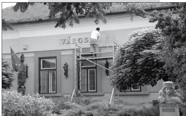
Torda Ferenc munkálkodik.