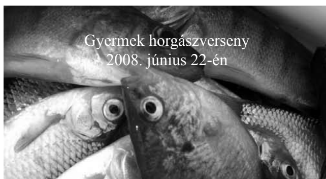
Gyermek horgászverseny 2008. június 22-én