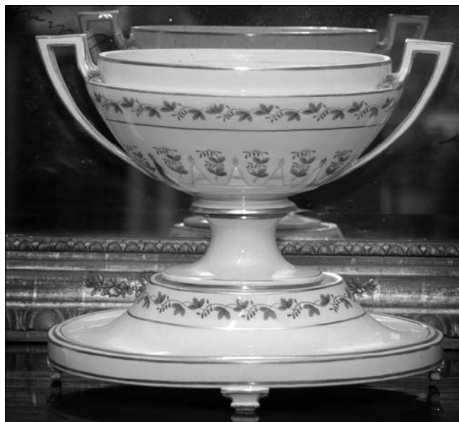
Foto: levesestál a hajdani Gorove-kastélyból