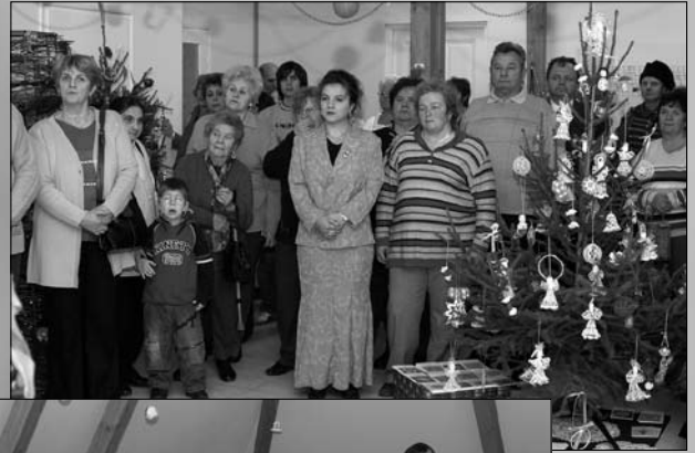
Mindenki karácsonya, 2008. december 14.