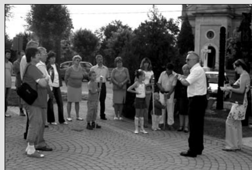
Szent Iván-éj a Tiszán