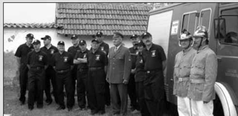
Tűzoltó egyesület szertárának átadása és a tűzoltóautó megáldása, május 18-án.