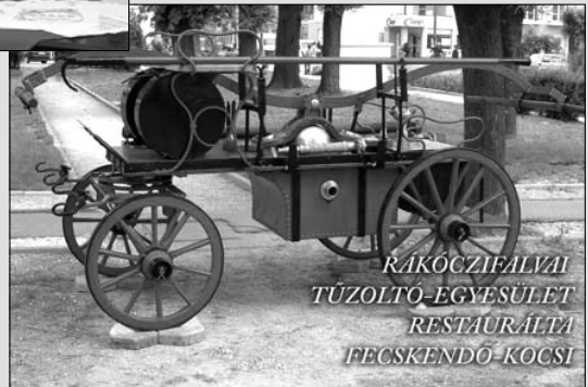
RÁKÓCZIFALVAI TŰZOLTÓ-EGYESÜLET RESTAURÁLTA FECSKENDŐ-KOCSI