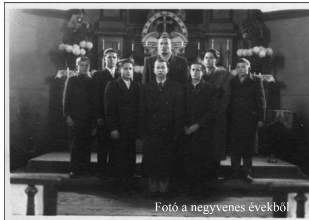
Fotó a negyvenes évekből