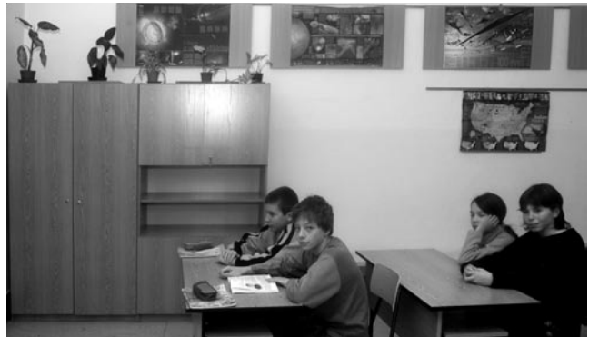
Új bútorok az iskolánkban