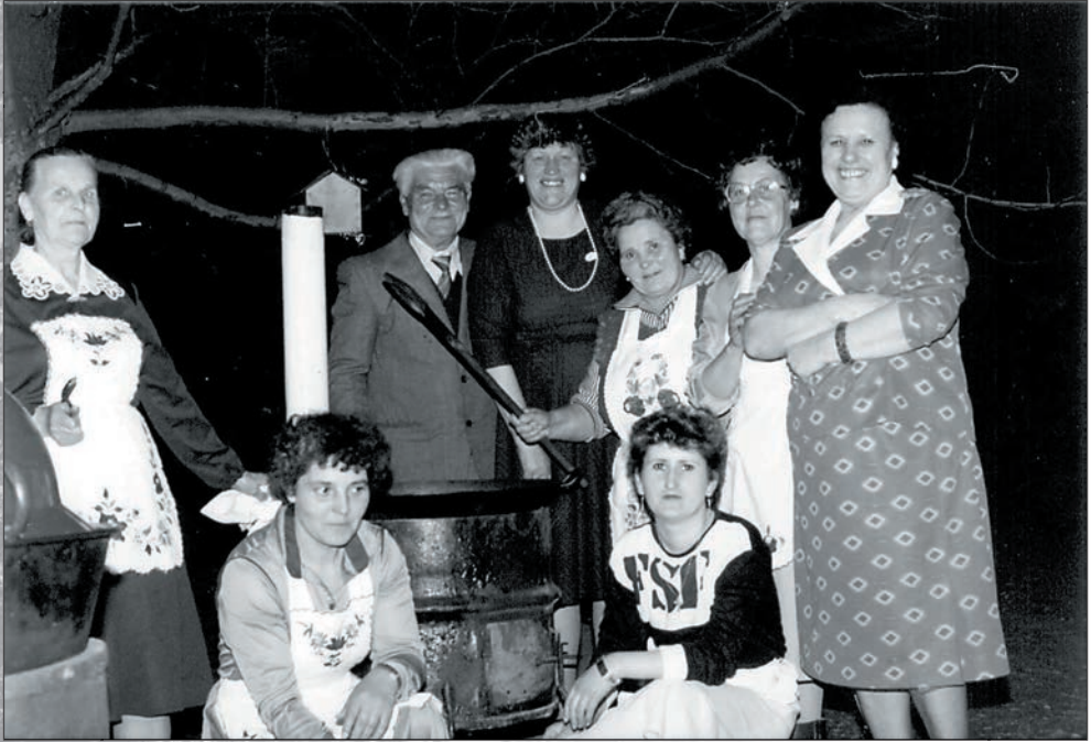
9. Nőnap i főzőcske 1987-ben