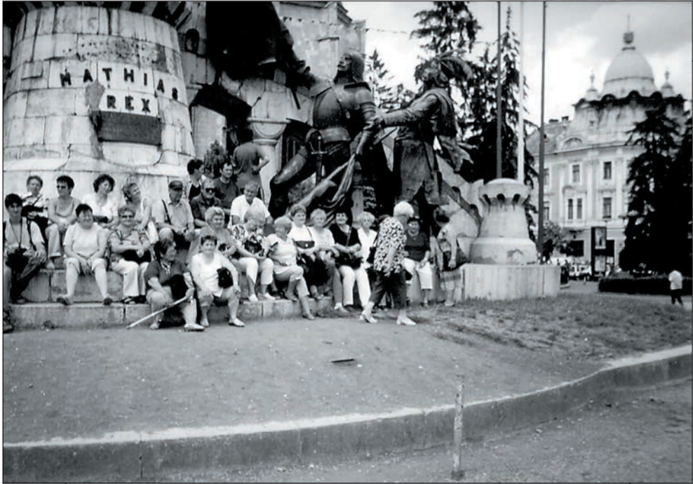
55. Kolozsvárott Mátyás király szobránál 2004 júniusában