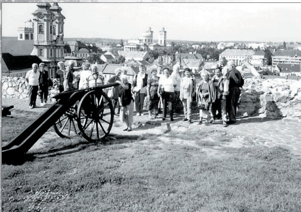
46. Egri kirándulás 2003-ban