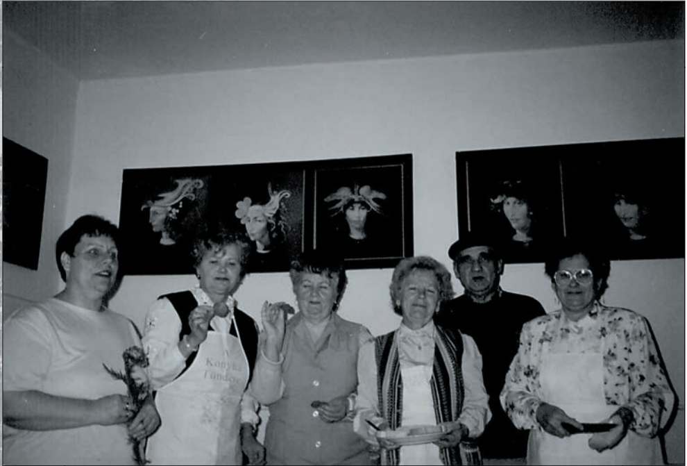
33.Nőnapra készülődtünk a régi Faluházban 2002-ben