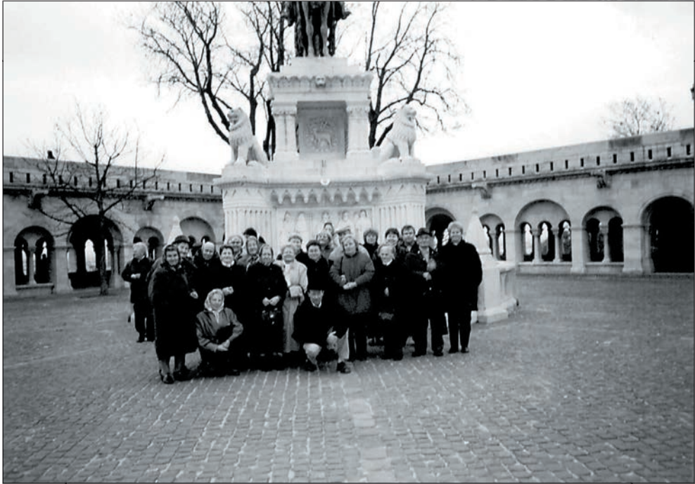
47. Budapesti kirándulás 2003 novemberében