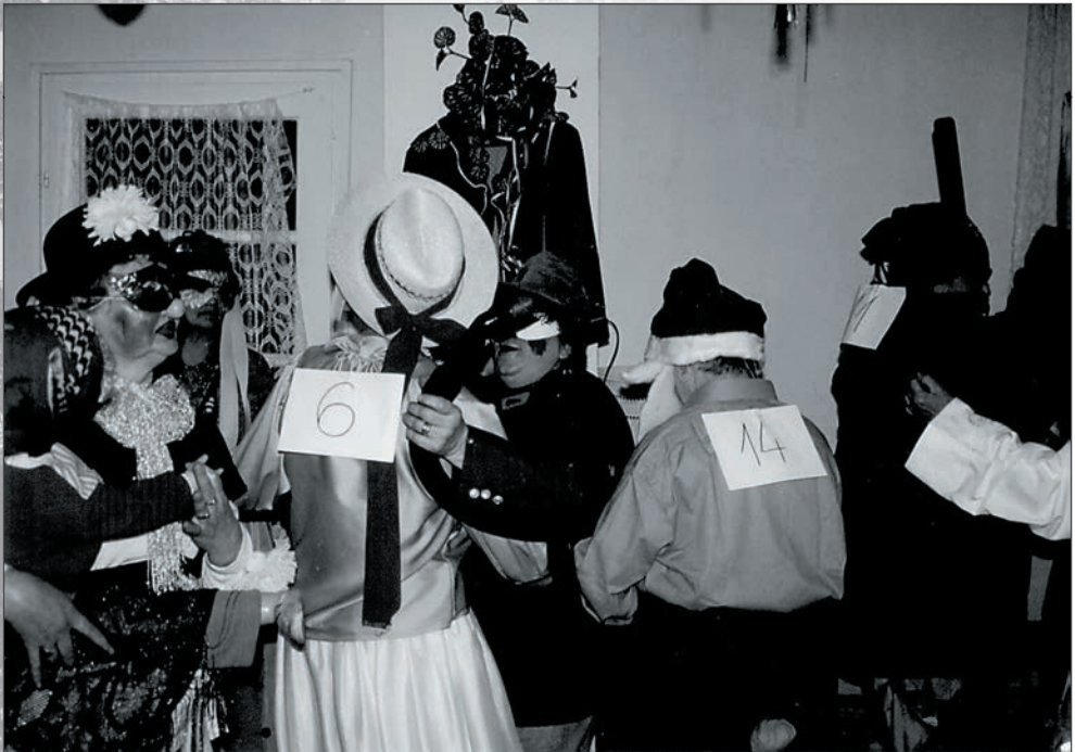
30. Farsang 1998-ban