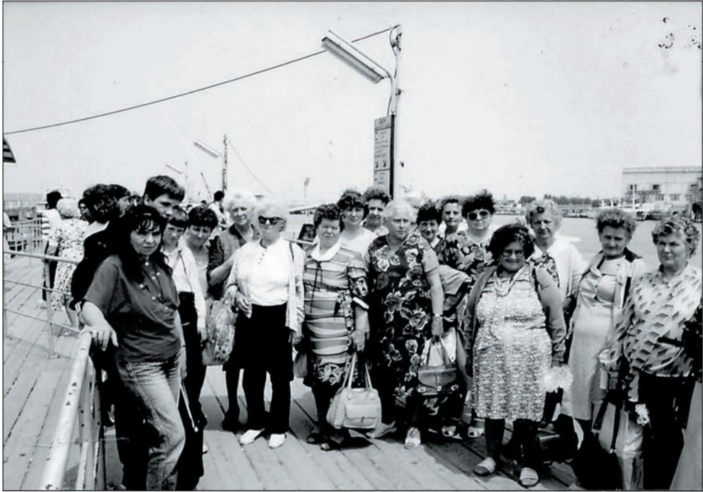
23. Velencei kirándulás – csoportkép a mólón 1996-ban