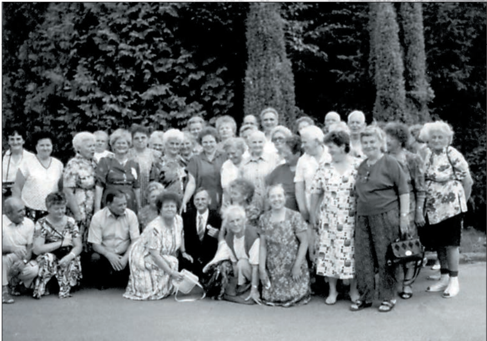
28. Kirándulás 1998 nyarán