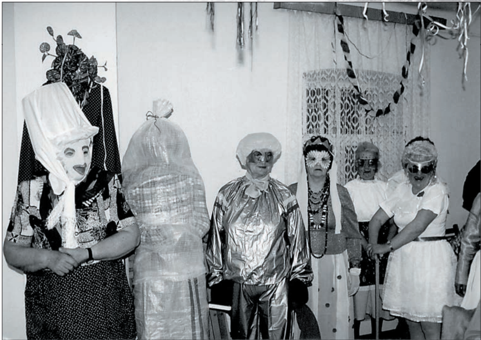
24. Farsang a klubban 1997-ben