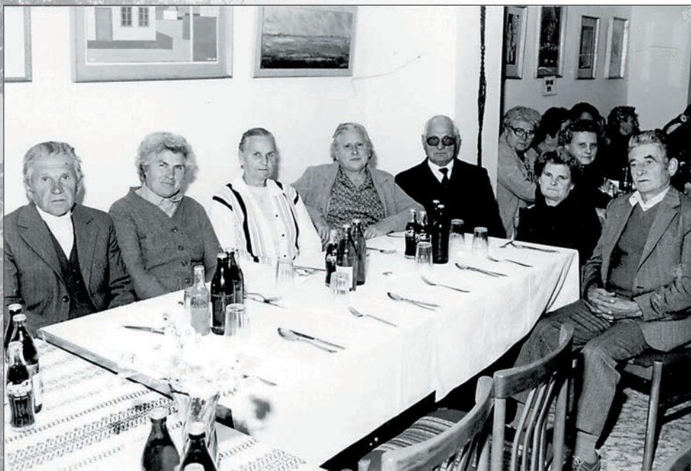
13. Névnapozás 1988-ban