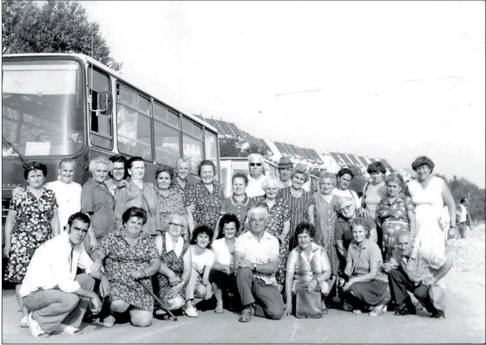
3. Kirándulás Sümegre 1985-ben