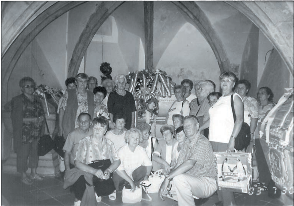
44.Rákóczi fejedelem sírjánál is tisztelegtünk 2003 nyarán