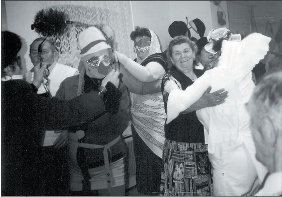
19.Karneváli hangulat 1993-ból