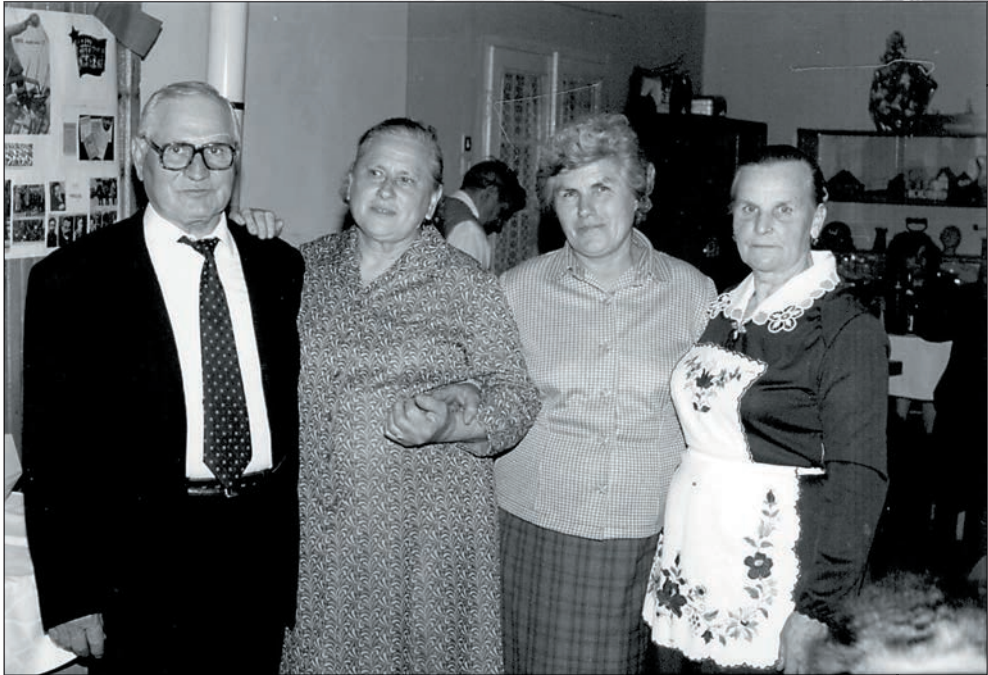
8.A Vadász házaspár házassági évfordulója 1987-ben