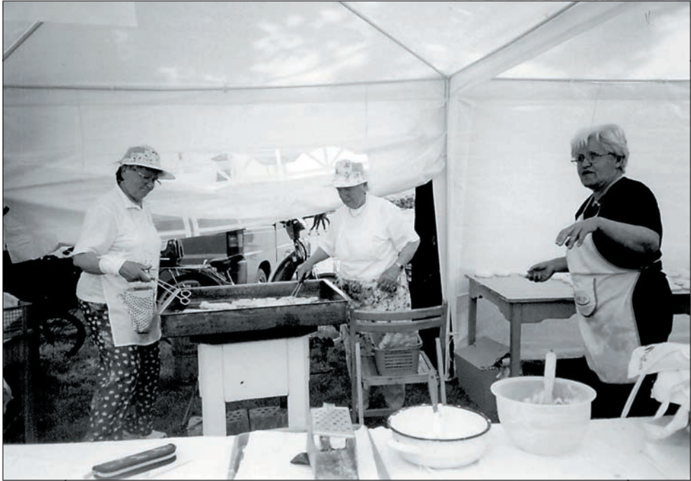
63. A Rákóczi Majális 2005-ben is elképzелhetetlen volt lángos nélkül