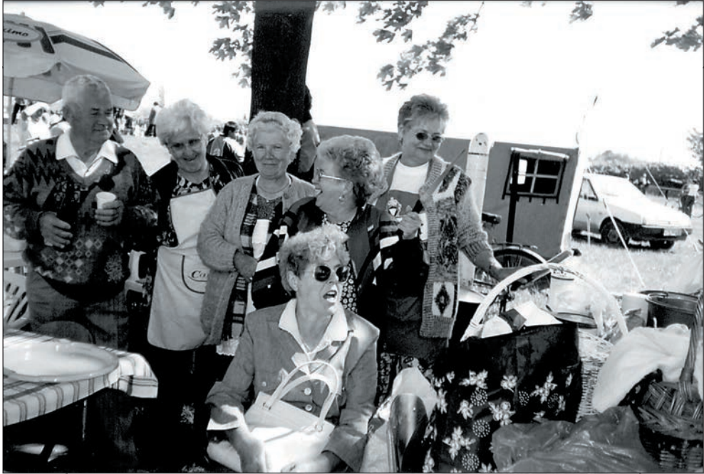
39. Majális a sportpályán 2002-ben