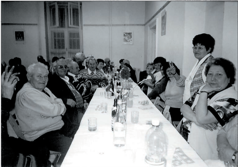
52. Nőnap a Faluházban 2004-ben