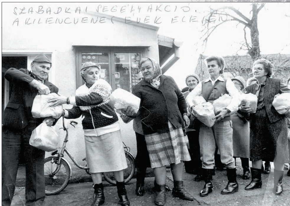
15. Segélycsomagok átadása Szabadkán 1992-ben – A szerb háború idején klubunk gyűjtést szervezett a megyében. Harminchat település csatlakozott hozzánk. Szabadkai barátaink megsegítésére 324 darab, egyenként 7,5 kilós csomagot állítottunk össze. A csomagban cukor, só, rizs, felesborsó, étolaj, száraztészta, margarin, májkrém, leveskocka és alma volt.