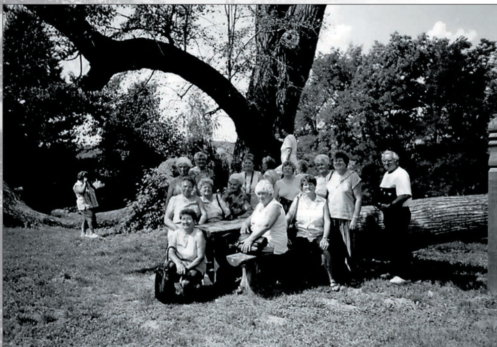
66. Madách Imre fájánál is jártunk 2005 júliusában