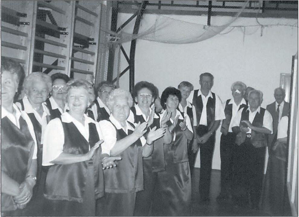
49. Színfalak mögött - Idősek Világnapja 2003-ban