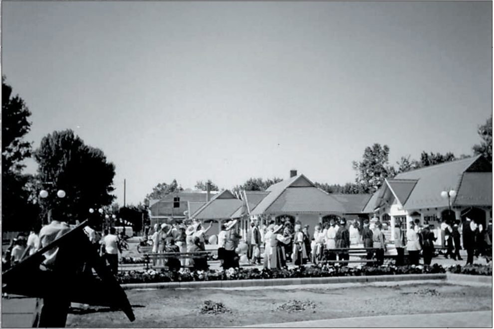
29. Cserkeszölői nyugdíjastalálkozó 1998-ban