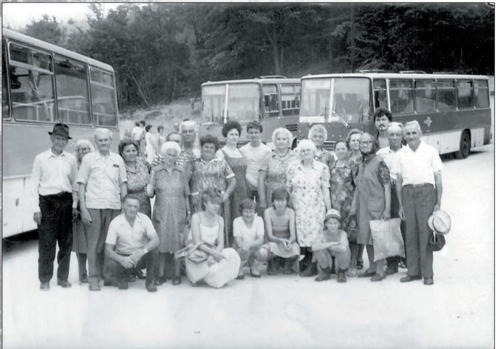
18.Egerben is jártunk 1993-ban