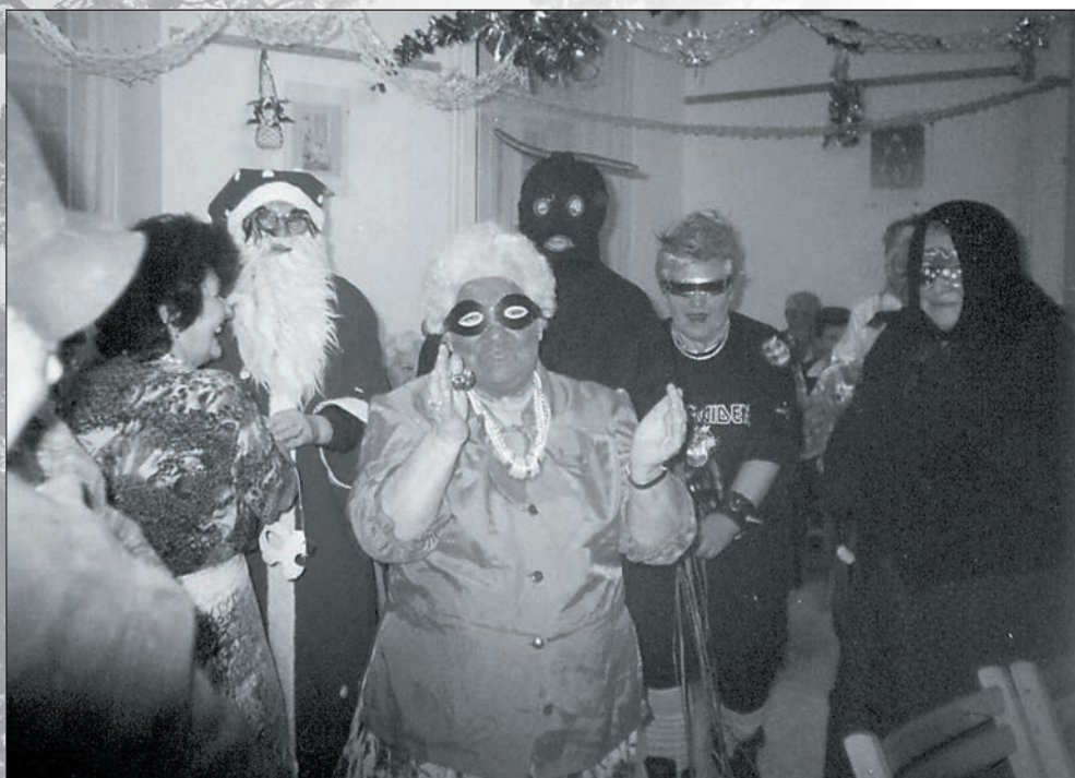
62. Így farsangoltunk 2004-ben