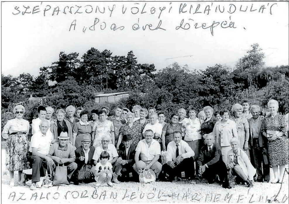
4. Kirándulás a Szépasszony-völgyben a nyolcvanas évek közepén