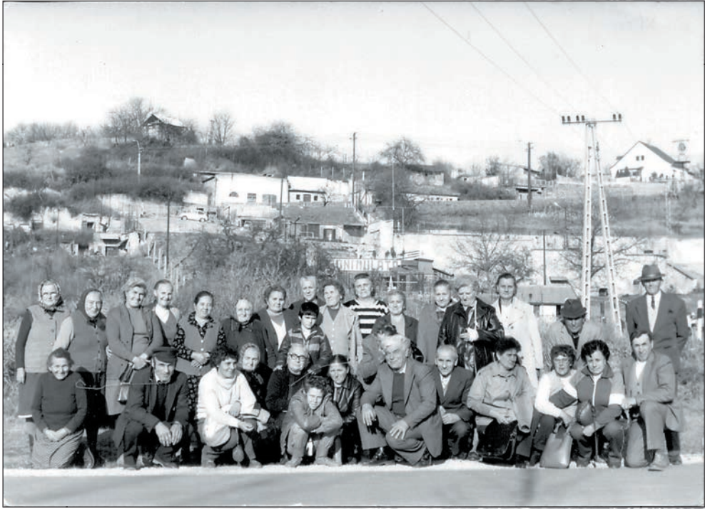
11. Kirándulás 1986 októberében