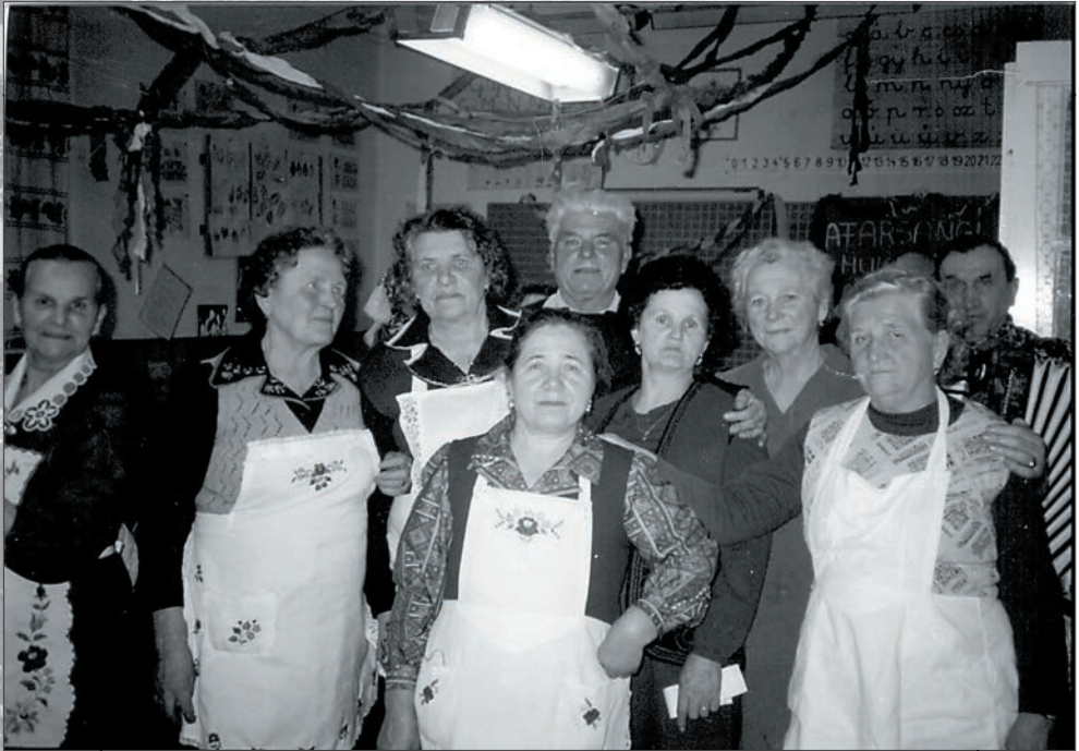
10. Farsangi főzés 1987-ben