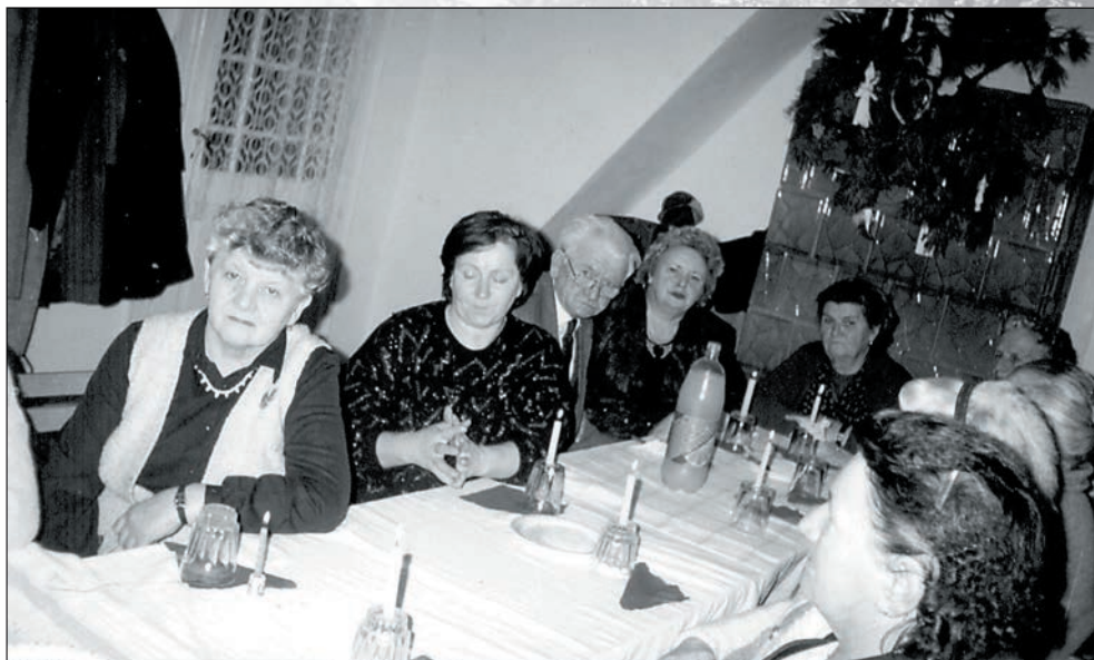
16. Karácsonyi ünnepség 1993-ban