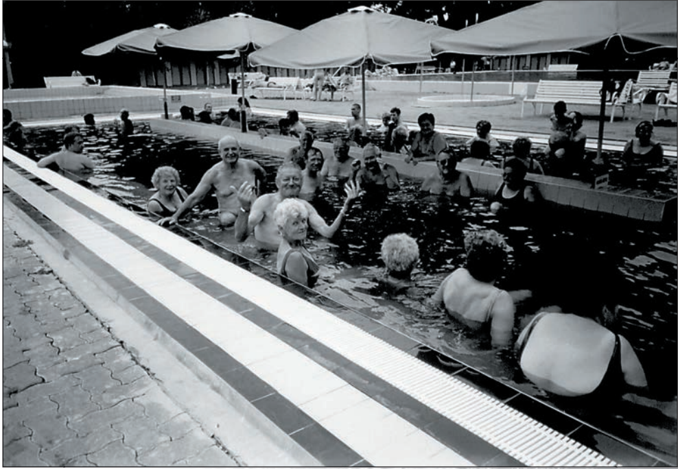
67. Pihenünk a gyomaendrődi fürdőben 2005-ben