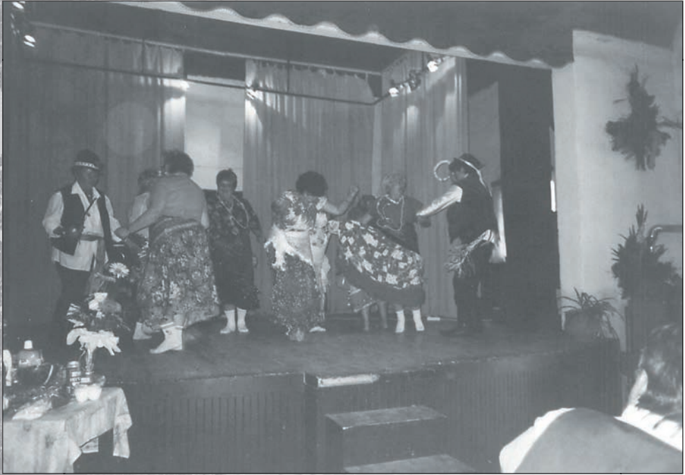
73. Túrkevéen is nagy sikert aratott a cigánytánc 2005-ben