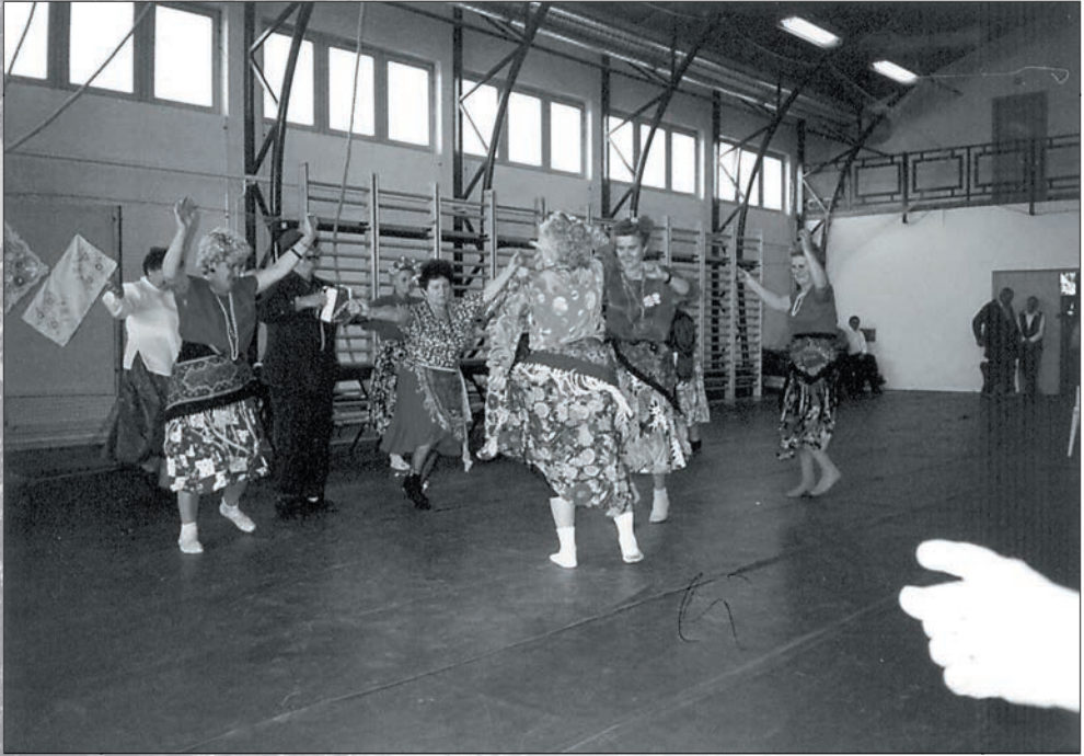
21. Felforrósítottuk a hangulatot 1996-ban is az Idősek Világnapján