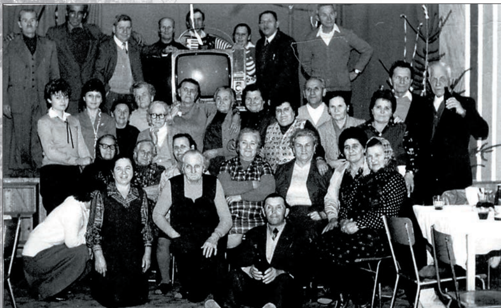
1. Karácsonyi ünnepség 1975-ben