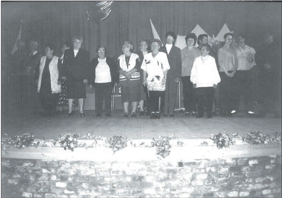
60. Névnepesokat köszöntöttünk a közösségi házban 2004-ben