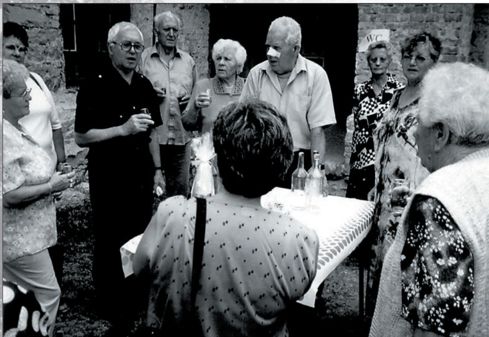
42. II. Rákóczi Ferenc szülőházánál, Borsiban jártunk 2003-ban