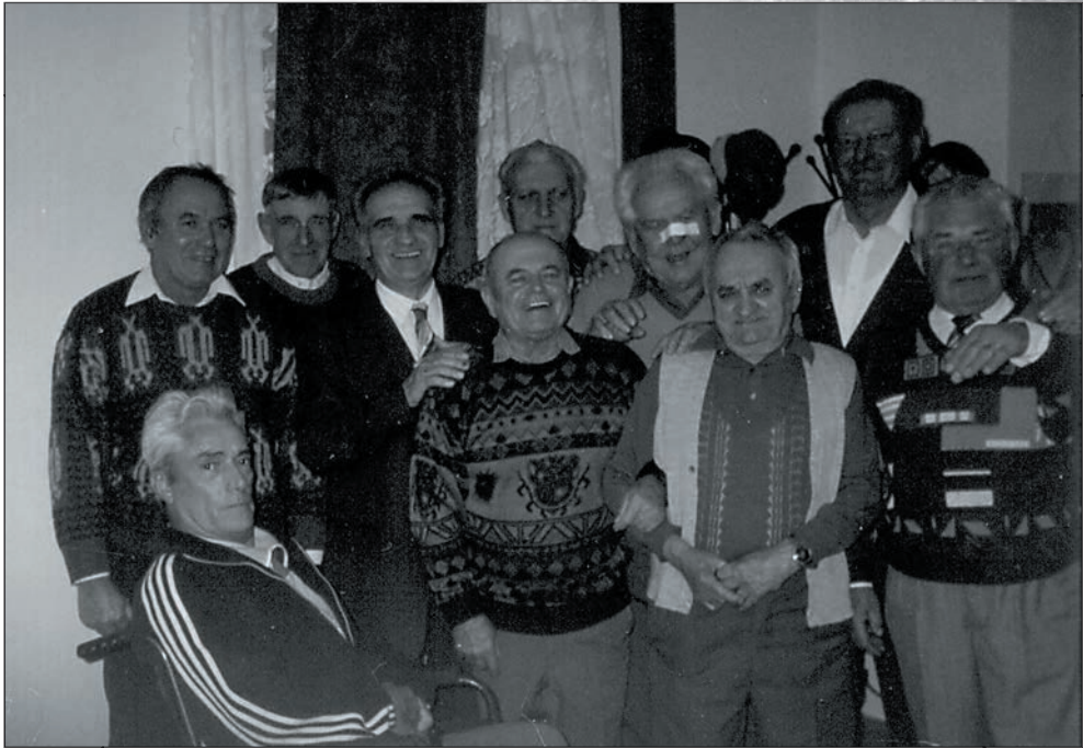
32. Férfinapot tartottunk 2001-ben