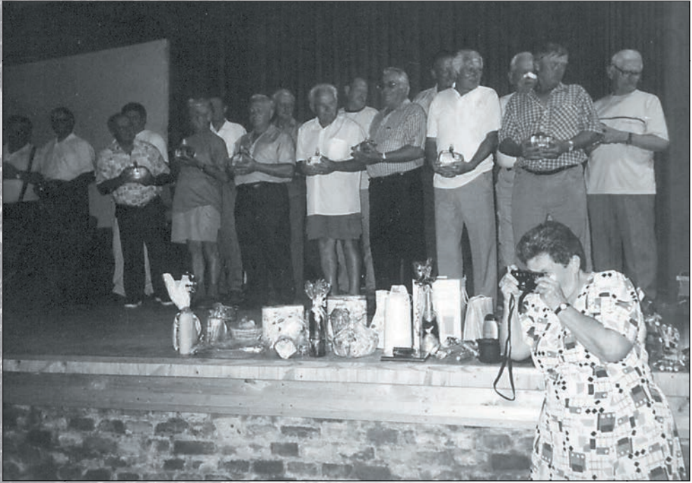
69.Férfinap a Varsány Községi Házban 2005-ben