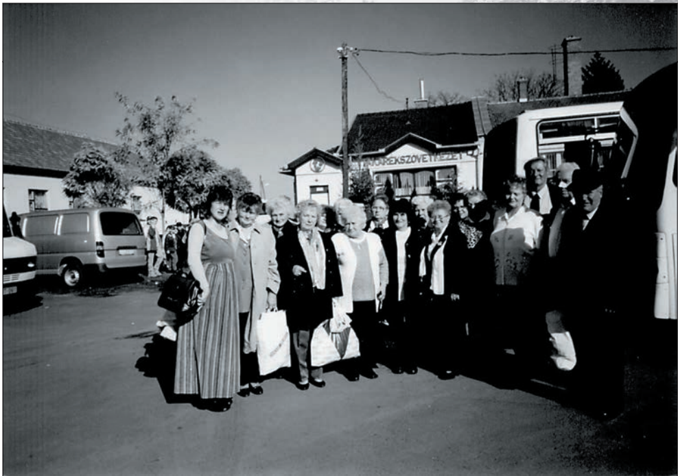
48. Népdalkörünk minősítő versenyre utazott Zagyvarékasra 2003-ban