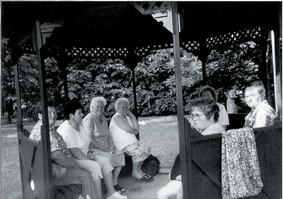
38. Pihenés Gyopárosfürdőn 2002-ben