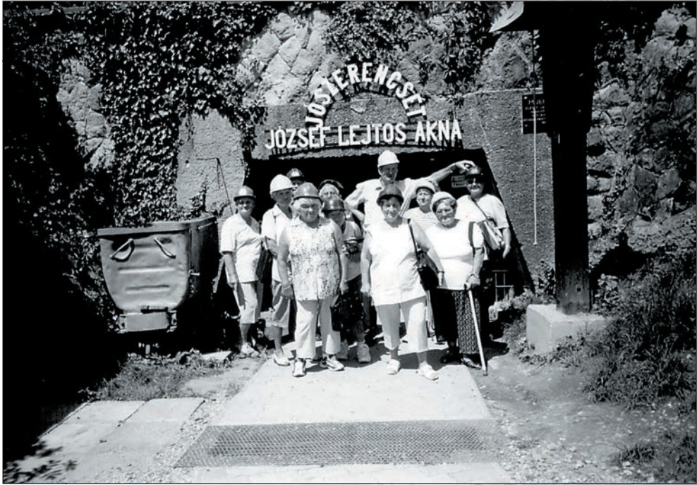
71. A salgótarjáni bányamúzeum bejáratánál 2005-ben