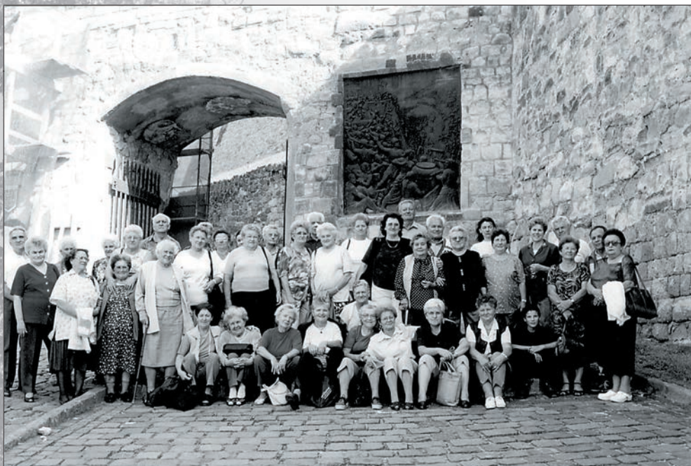
45. Az egri várban is körülnéztünk 2003 májusában