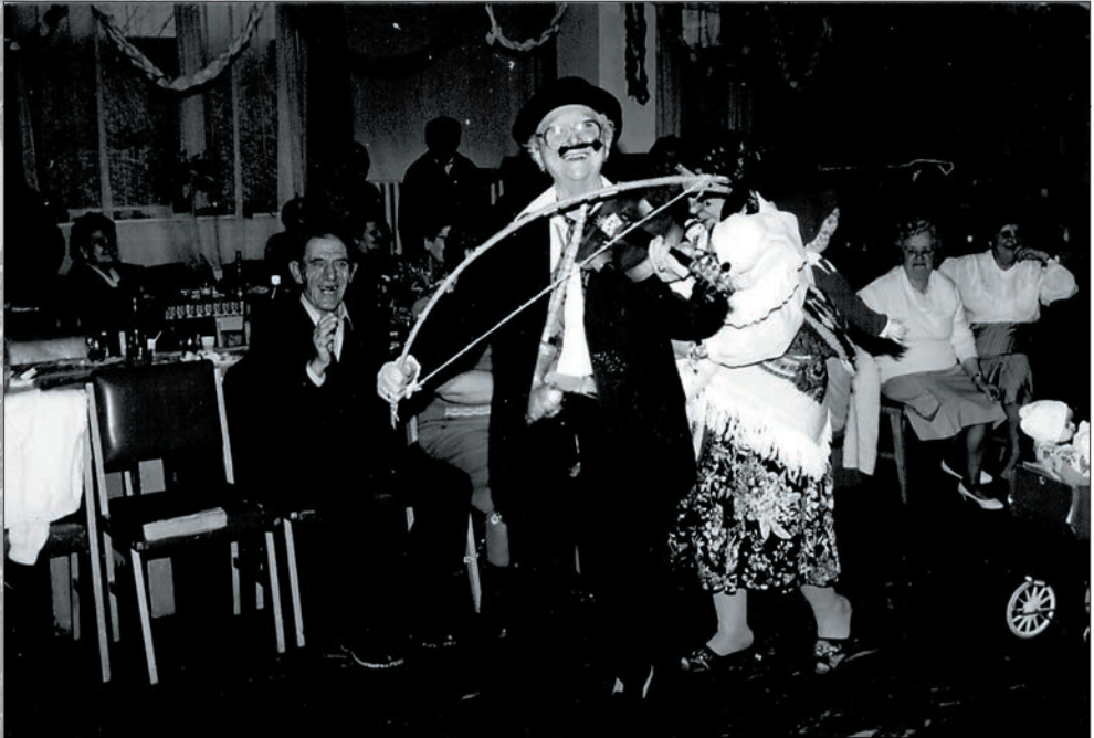
17.Farsangi mulatság 1993-ban