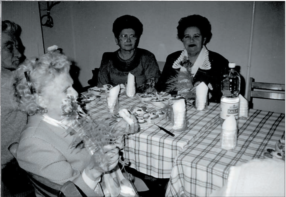
58.Egy-egy szál virág az ünnepelteknek - nőnap 2004-ben