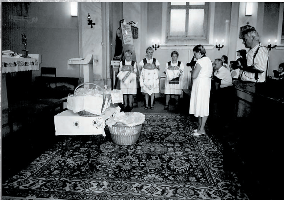
61. Kenyérszentelés a katolikus templomban 2004. augusztus 19-én