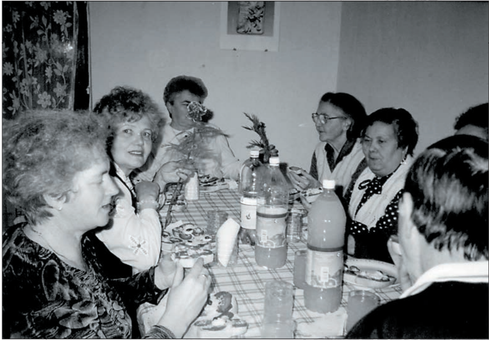
35.Névnapot ünnepeltünk 2002-ben