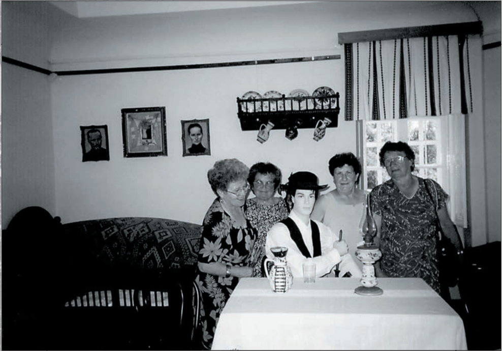
37. Orosházi múzeumlátogatás 2002-ben