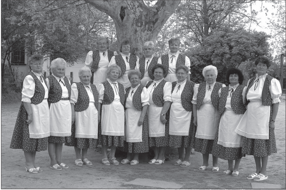
75. Rákóczi Népdalkörünk