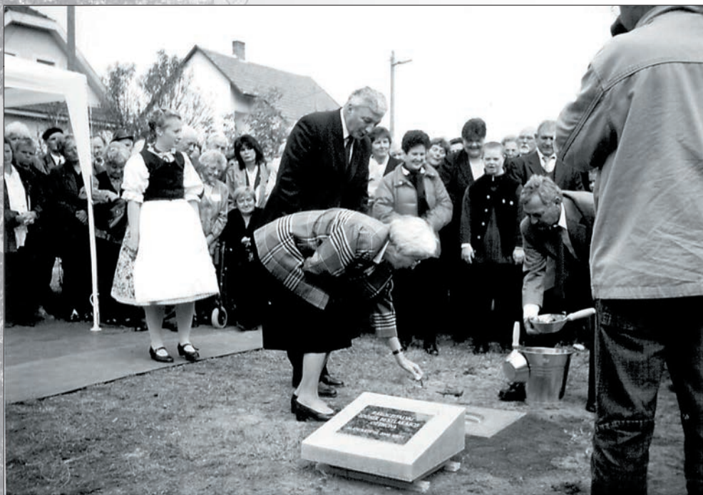
41. Az idősek otthonának alapkövetétele 2002-ben