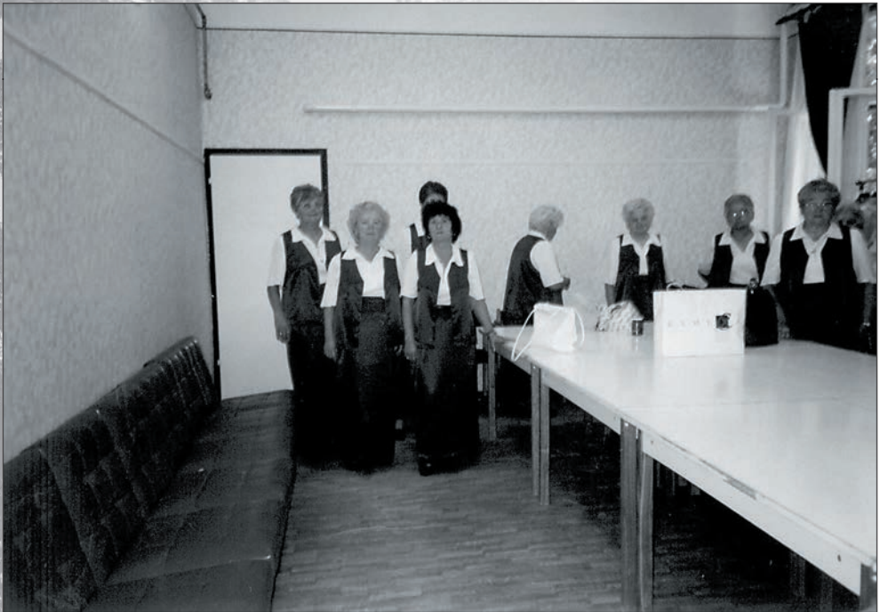
70.Énekarunk minősítő versenyre várva Zagyvarékason 2005 szeptemberében