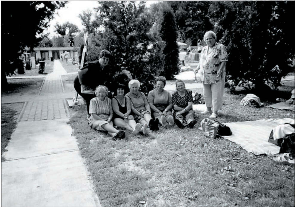
68. Kipihenjük a pihenés fáradalmait a gyomaendrődi fürdőben 2005-ben