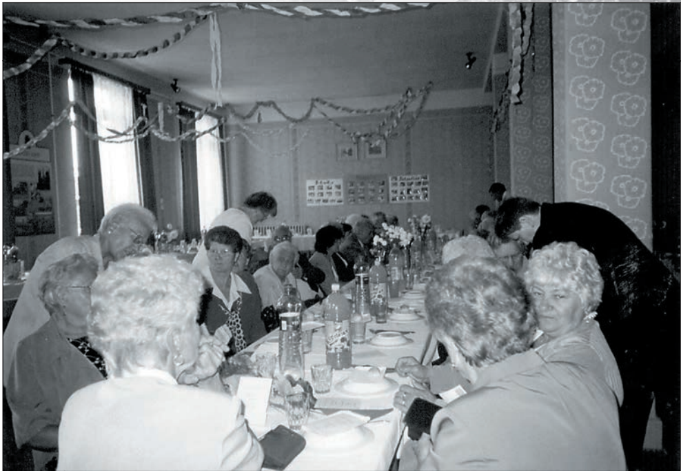
72. A jásziványi testvérklub vendégei voltunk 2005-ben