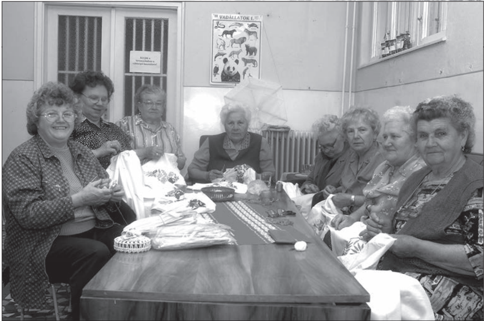
76. Kézimunka szakkör