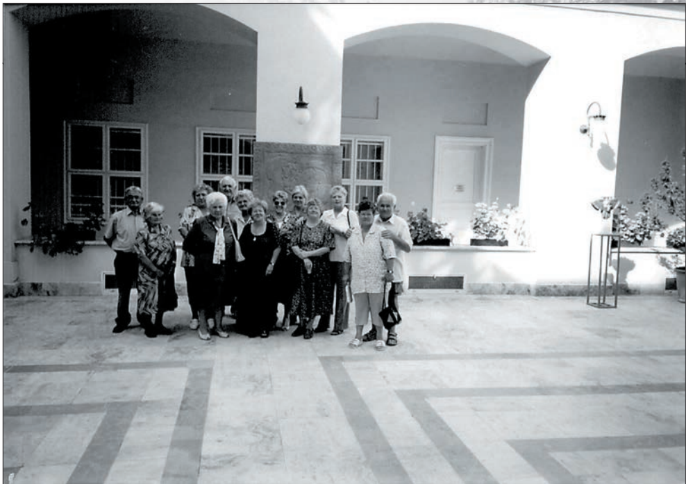
56. A szolnoki Damjanich Múzeum udvarán 2004-ben