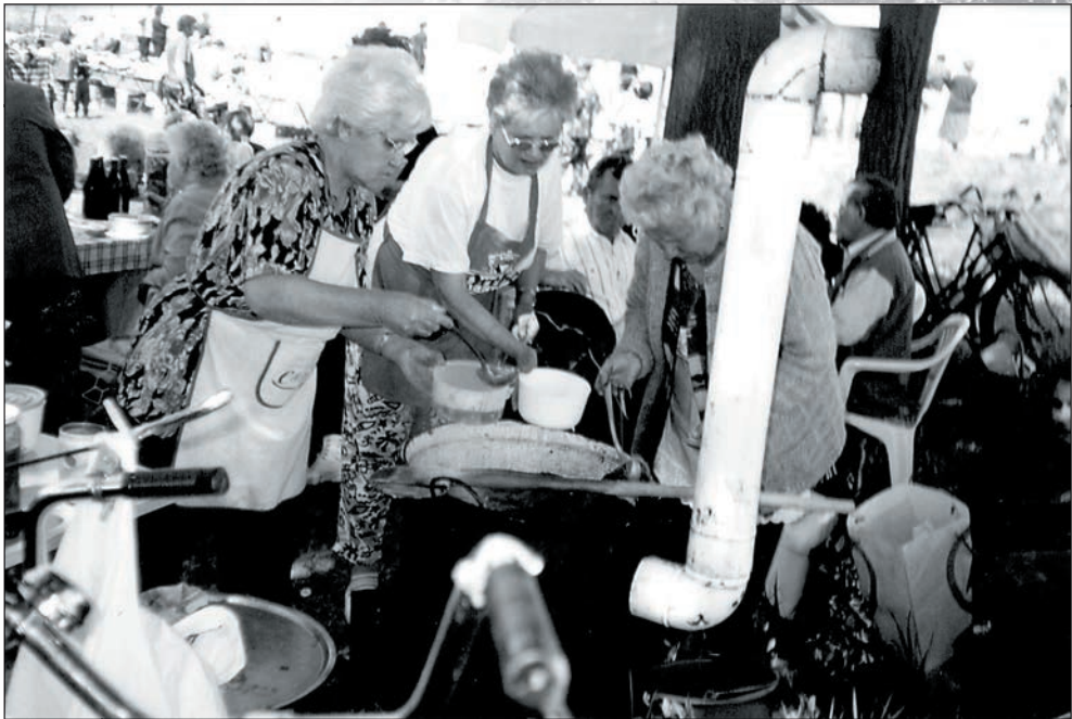
40. Kondérban főztünk a majálison 2002-ben