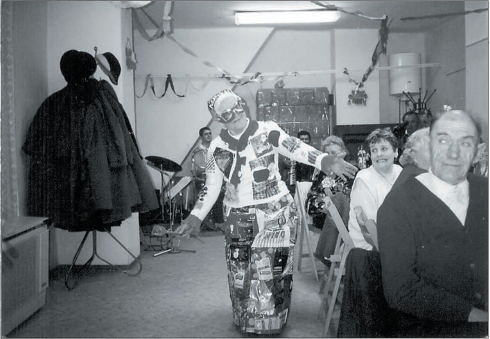
25. Egy különösen jól sikerült jelmez 1997-ből