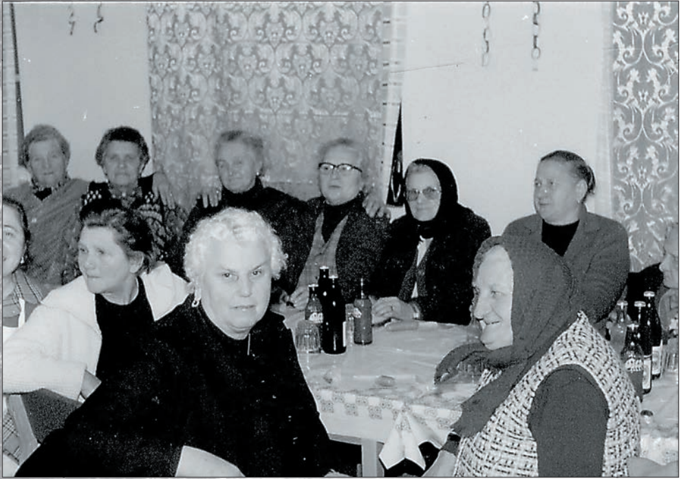
5.Tagösszejövetel 1985 tavaszán