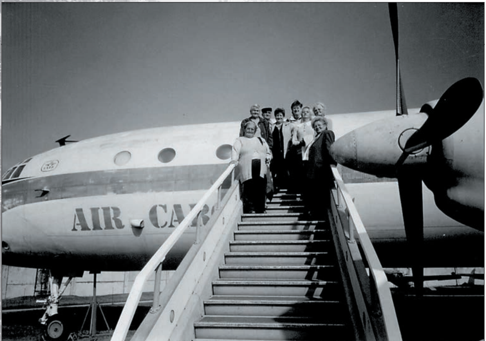
74. A szolnoki Repülőkúszomban 2005 októberében