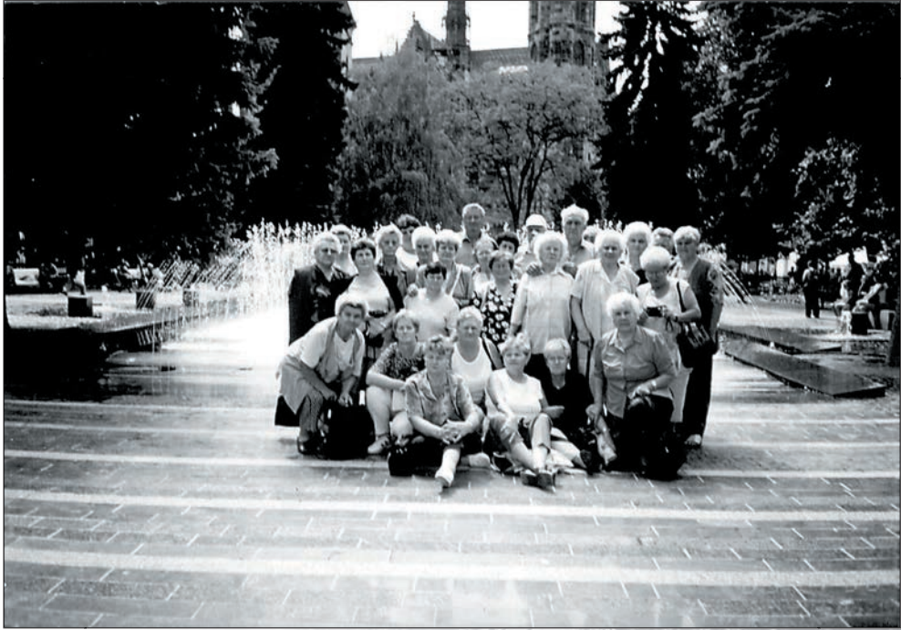
43.Kassai kirándulás 2003-ban