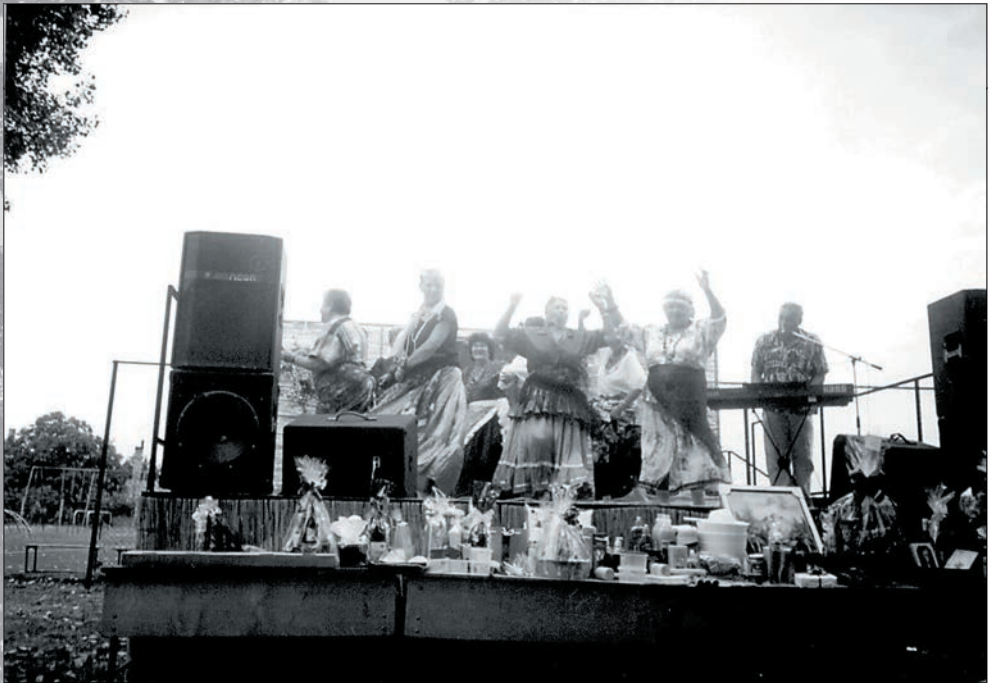
54. Jászszentandrászi fellépés 2004 augusztusában