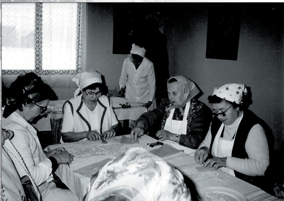
14. Így készült a csigatészta 1994-ben