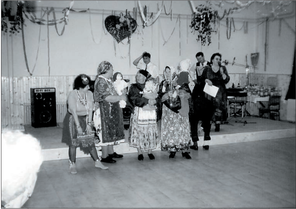
27. A kengyeli testvérklubnál is felléptünk 1997-ben