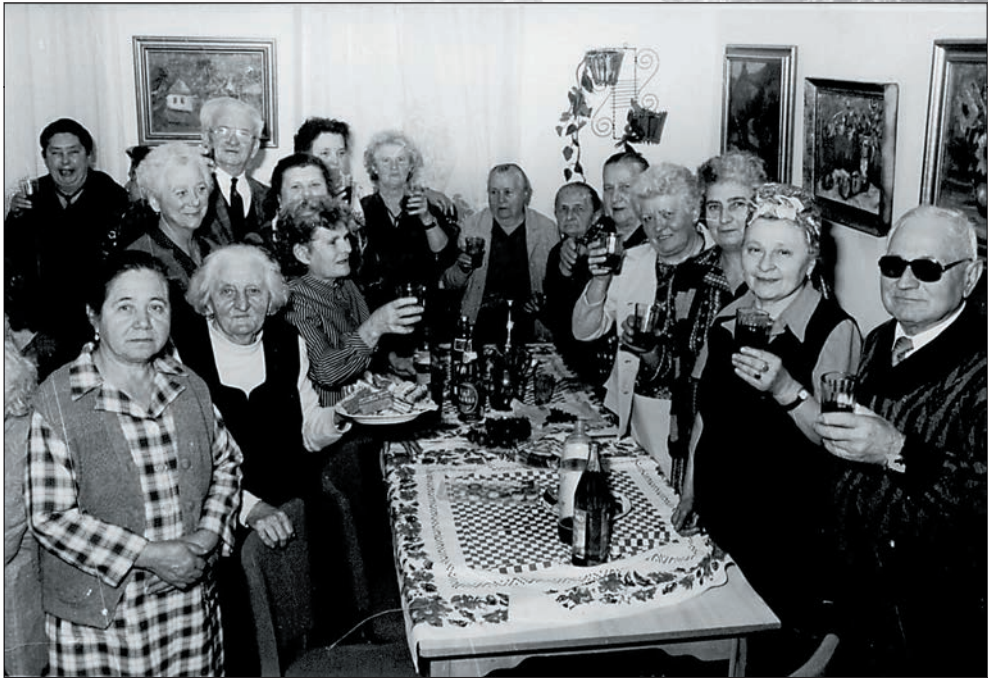
12. Névnapi köszöntés 1990-ben