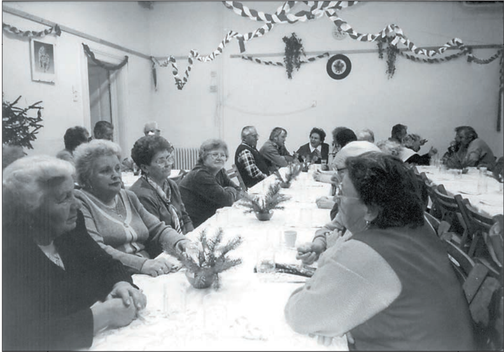
51. Együtt is karácsonyoztunk 2003-ban