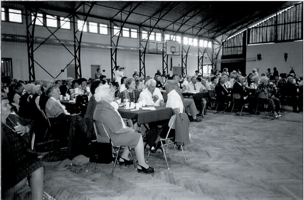
50. Teltház a sportcsarnokban – Idősek Világnapja 2003-ban