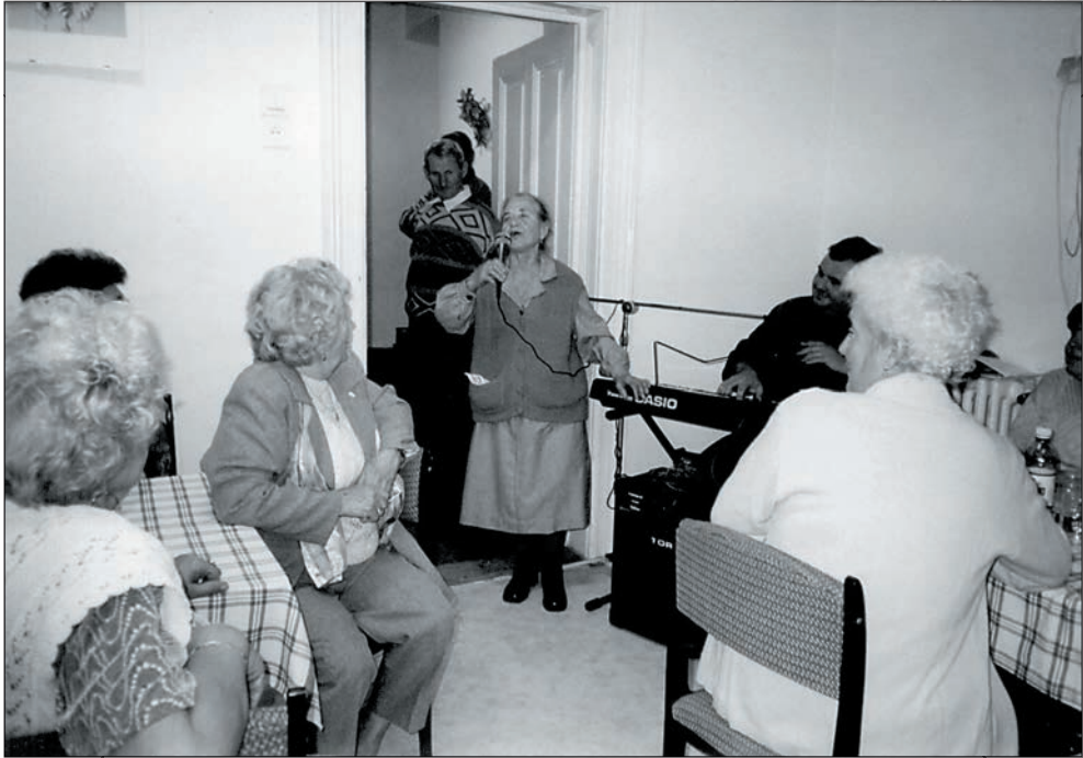
59. Nótás kedvűek vagyunk - nőnap 2004