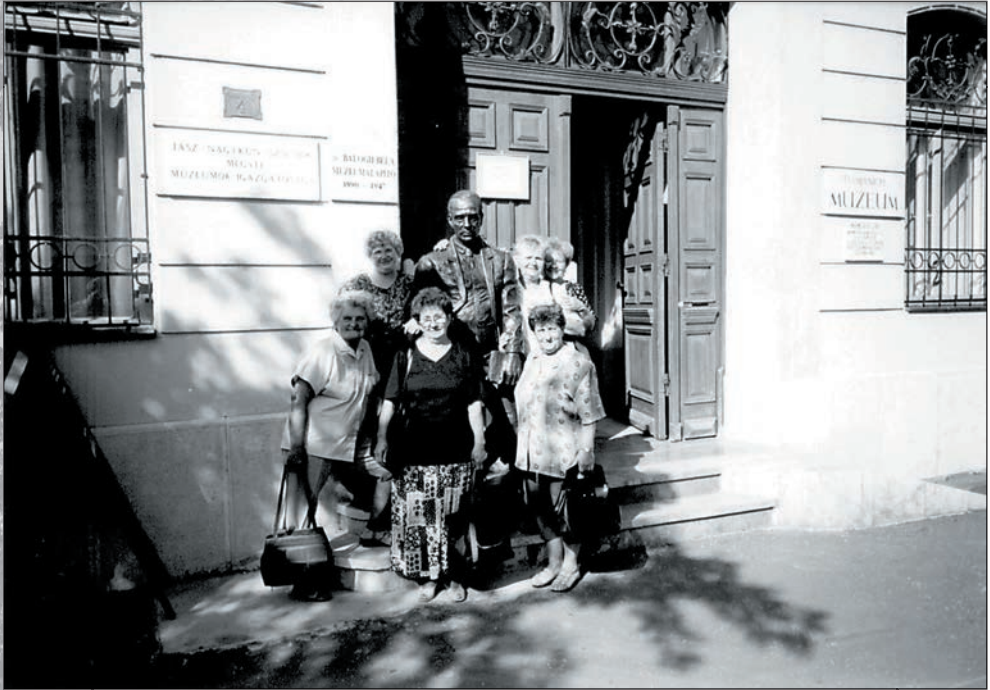
53. A szolnoki Damjanich Múzeum bejáratánál 2004-ben