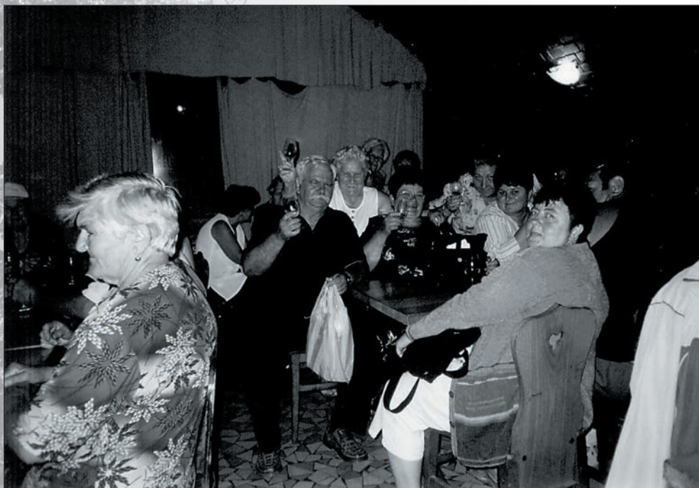
65. Jó hangulat az abasári borospincében 2005 júniusában