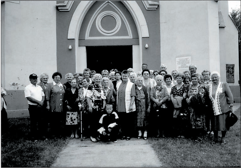
31. Jászszentandrás kirándulás 1999-ben