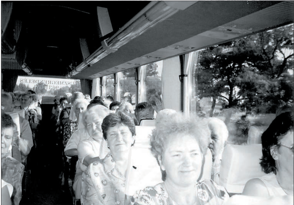
36.Úton Orosházára 2002 nyarán