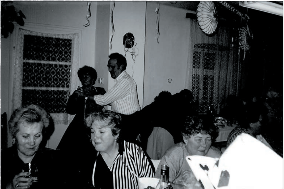
22. Faschang 1996-ban