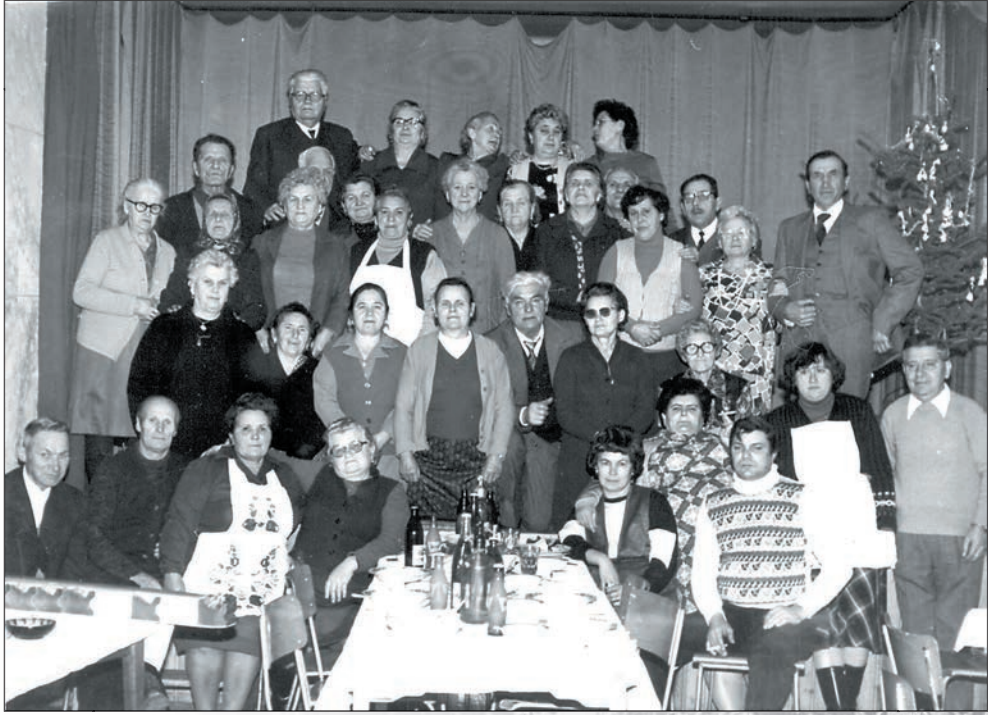
7.Névnapi köszöntés 1986-ban